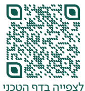
לצפייה בדף הטכני