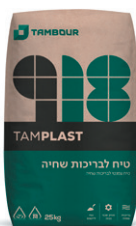
טיח לבריכות שחייה 918