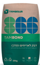
דבק לאריחים 866